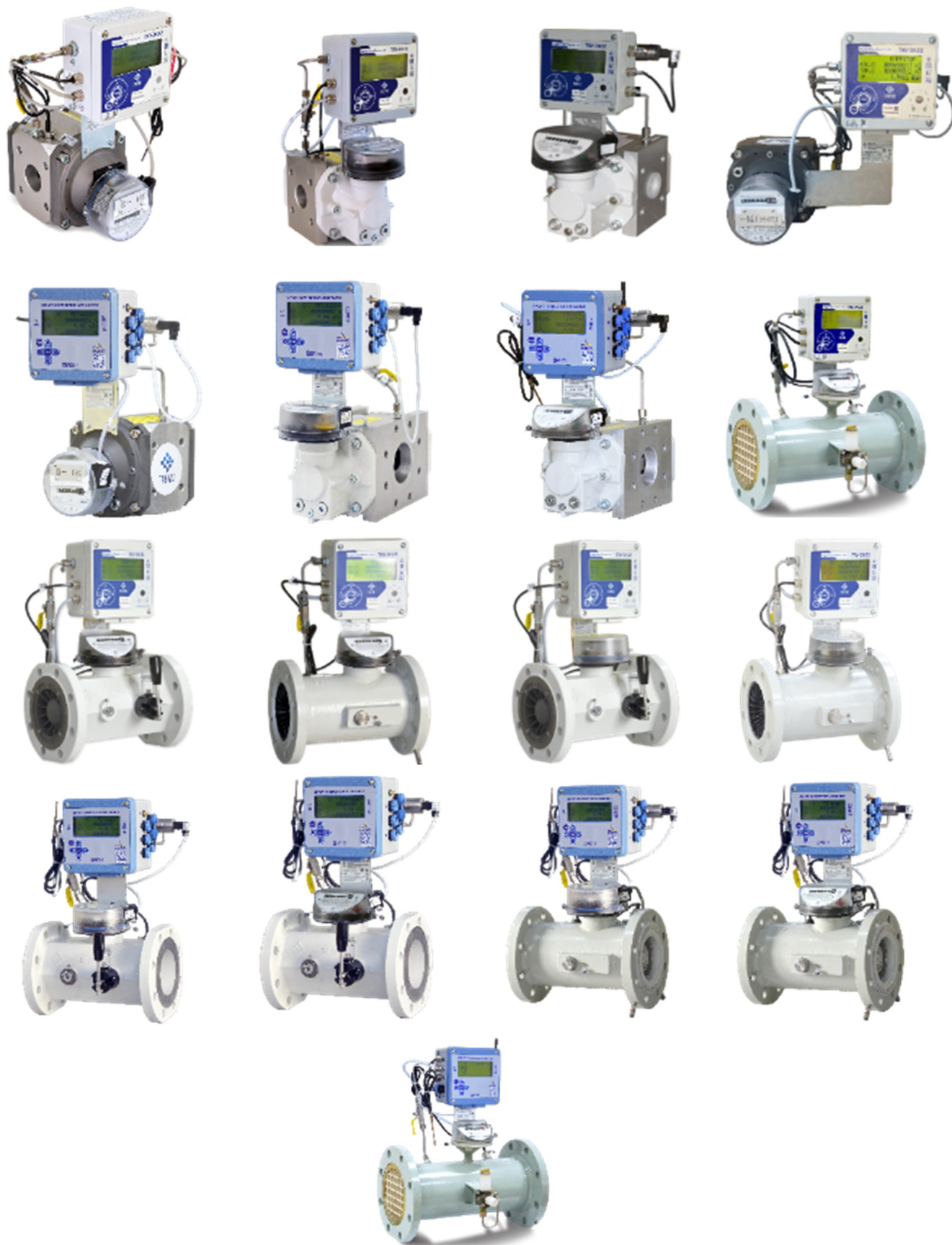
Рисунок 1 – Общий вид основных исполнений комплексов