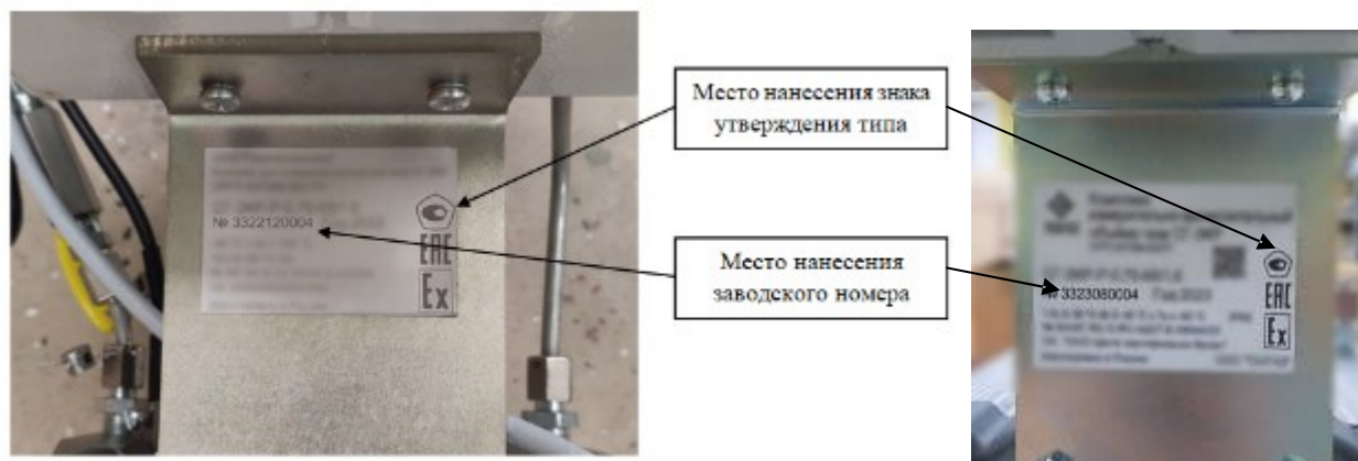
Рисунок 4 – Место нанесения заводского номера и знака утверждения типа

Заводской номер в виде 10 арабских цифр наносится методом термопечати, металлографии и/или гравировки на шильдик, расположенный на крепежной пластине корректора. Места нанесения заводского номера и знака утверждения типа представлены на рисунке 4.